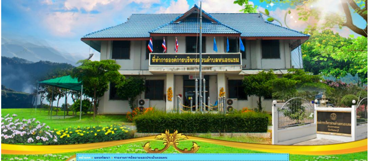
หน้าปก : แผนที่พัฒนา รายงานการติดตามและประเมินผลแผน

แบบฟอร์มบันทึกข้อร้องเรียน สำหรับเจ้าหน้าที่ บันทึกข้อมูลการรับร้องเรียนเป็นประจำทุกวัน