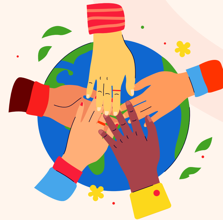
กองทุนส่งเสริมการจัดสวัสดิการสังคม