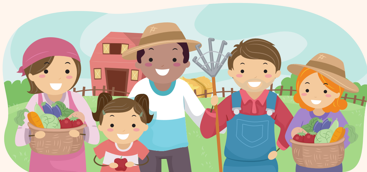
กองทุนสวัสดิการชุมชน